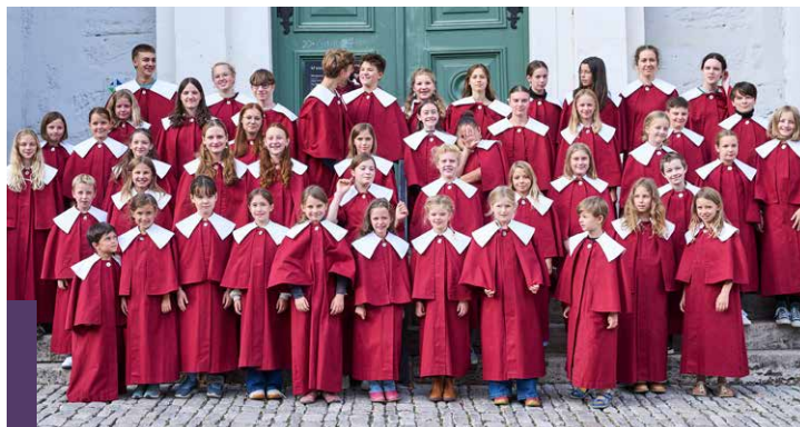
Evangelische Singschule Weimar

Jugendchor der Evangelischen Singschule Weimar