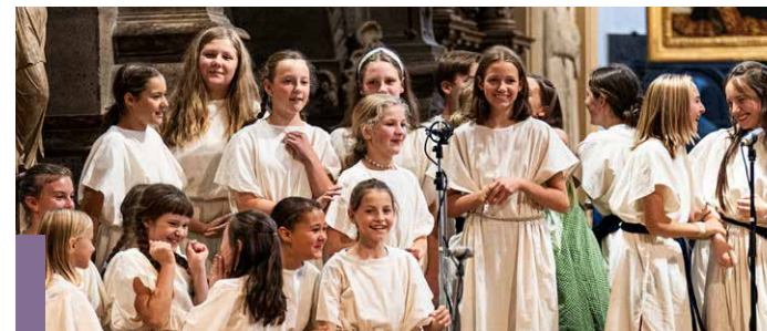
Musical der Evangelischen Singschule Weimar